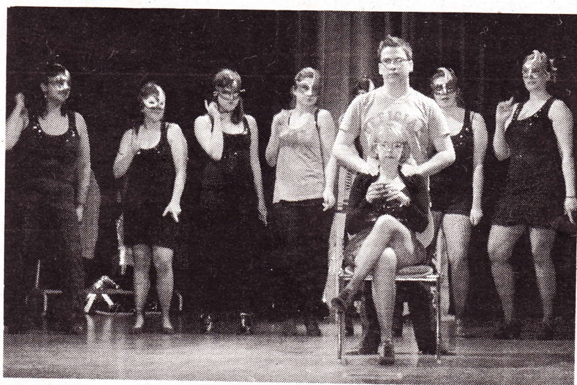
BUTZBACH. „Backstage – Hinter den Kulissen“ nannte sich das französische Theaterstück, das in manchen Teil stark an ein Musical erinnerte. Besonders die musikalischen Einlagen waren sehr gut gelungen. Text + Foto: ff